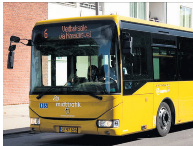
Horsens Kommune inviterer til borgermøde om den nye trafikplan 30. november på rådhuset.

Trafikplanen er lavet på baggrund af en digital spørgekemaundersøgelse, som